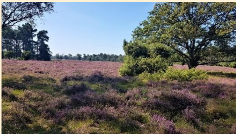
Het Buurse Zand, 22-08-2019

Nu ik deze blog voltooi, is het inmiddels 25 0 graden geworden. We fietsten vandaag zo’n 37 km via fietsknooppunten – door heidevelden, dorpen, stadjes en akkers. Wat genieten we van het goede leven, van een prachtige nazomer in Twente. En wat geeft het me – nadenkend over het gezin waarvan ik deel uit mag maken – een goed gevoel dat we er als vier broers (één broer is helaas overleden) steeds beter in slagen om verleden en heden te delen en daarin betekenis voor elkaar te hebben, hoe verschillend we soms ook denken en leven. En wat een voorrecht dat we als (groot)ouders met onze (klein)kinderen in staat blijken te zijn om samen te genieten van het leven én verdriet te delen. Voor wie niet zwijgt maar geluk en ongeluk deelt is het leven goed. Dát is het geheim van betekenisvol samenleven en dat geheim deel ik graag met jou. Hoe vaak is zwijgen wél goud?