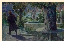
Der Lindenbaum – Hans Baluschek