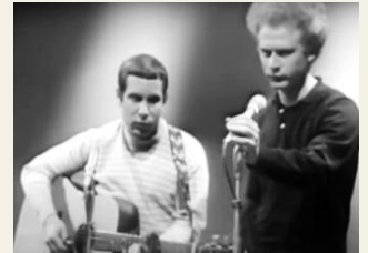
Paul Simon [links] en Art Garfunkel, beiden 26

Als in 1981 Paul Simon en Art Garfunkel een liefdadigheidsconcert geven in Central Park Washington, luisteren 500.000 mensen (!) naar Art Garfunkel die de song Bridge over troubled water van Paul Simon zingt. Als de eerste klanken direct door die honderdduizenden herkend worden, klinkt luid gejuich, maar al gauw wordt het – eigenlijk onvoorstelbaar – heel stil. Simon laat het lied in een geweldige climax eindigen en als Garfunkel in zijn laatste noten de overwinning van de liefde heeft bezongen, breekt in het naspel direct een tumultueus applaus los en wordt er heftig gescandeerd. Het moet een onvergetelijke ervaring zijn geweest.