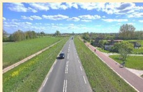
De IJsseldijk, vanaf de in 2011 geopende fiets-spoorbrug, de Hanzeboog