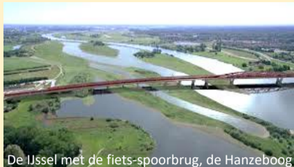
De IJssel met de fiets-spoorbrug, de Hanzeboog

Iedereen heeft zijn rivier 1 en ik, ik heb de IJssel.