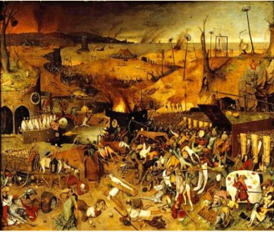
De overwinning van de dood, Pieter Bruegel de Oude

Het leven in de Middeleeuwen werd beheerst door twee vragen: wie is God en hoe zal het mij op de Dag des Oordeels vergaan? Hemel en hel waren – zeker in de jaren van de pest – heel dichtbij. Dat de pest een ziekte kon zijn lag ver buiten het gezichtsveld van de meeste mensen. De pest moest wel een plaag van God zijn. Maar ook: “de duivel dekt met zijn zwarte vlerken een duistere aarde. En spoedig wacht de mensheid het eind van alle dingen. Maar de mensheid bekeert zich niet; de Kerk strijdt, predikers en dichters klagen en vermanen tevergeefs.” 1 Er zouden